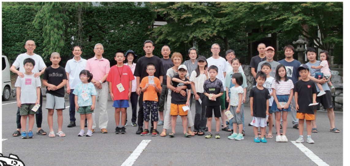
▲夏休みラジオ体操(7月22日～31日)