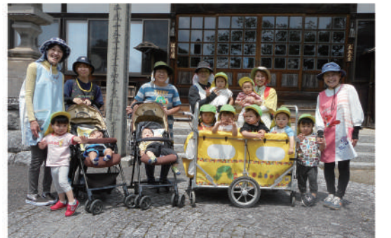
▲門前のツリートップ保育園のののさまお参り