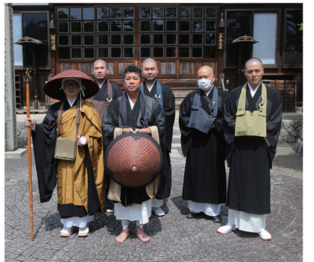
▲青年僧能登地震被災者支援町内托鉢(5月11日) 参加寺院 光渡寺、普門寺、大安寺、長泉寺 浄財15万2,785円 日本赤十字を通して送金

長泉寺の本堂は軒高がたい割に軒先の出が少ないうえに、雨の降るとは階段が濡れてしまいがちです。特に本堂の屋根は、焼香台まで雨が吹きつけ、状況が悪いです。この度、本堂正面の向拝(こうはい)・外屋の改修工事を実施することになりました。改修工事には、春彼岸明けから始まりますが、その間は法事やお参りにはお入りできません。中玄関から入りま