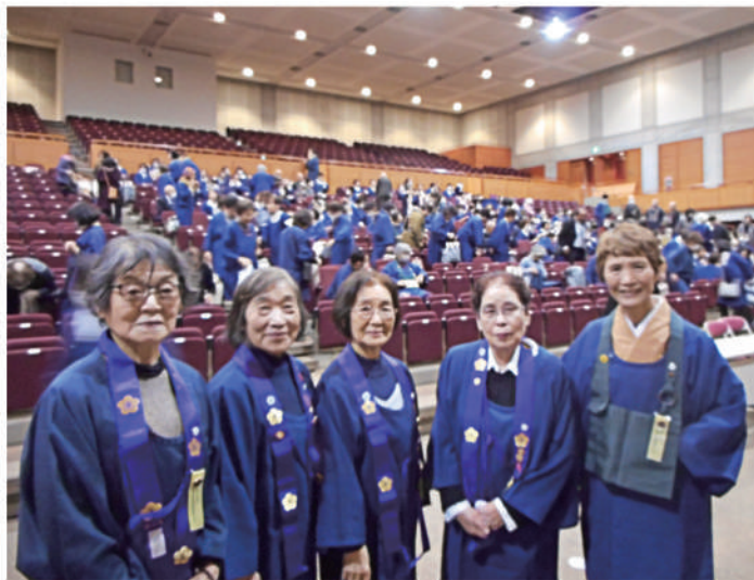
▲長泉寺梅花講 福島県奉詠大会参加 (11月5日 福島市パルセ飯坂にて)